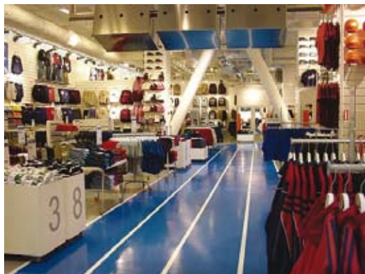
Os dados do contador de pessoas fornecem informações valiosas para o projeto do layout da loja.