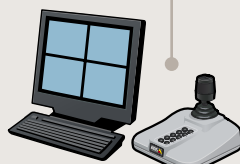
Monitoramento e gravação na loja